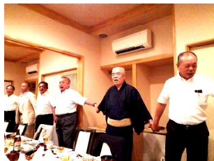
中締め(村上副会長)