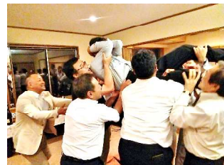
林前幹事 皆さん余力もなく？ あがりませんでした、