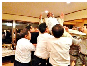
道脇前会長 何とかあがってます。