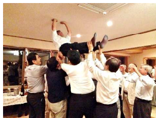
宮田前ガバナー補佐 あがりました！